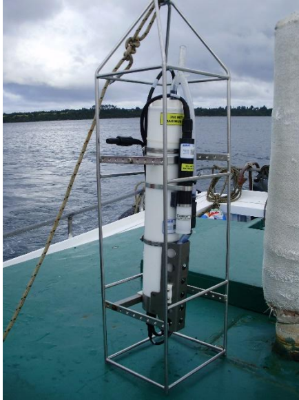
Figura 3 Equipo CTD Seabird® 19 empleado para el estudio de la salinidad y temperatura en la columna de agua.