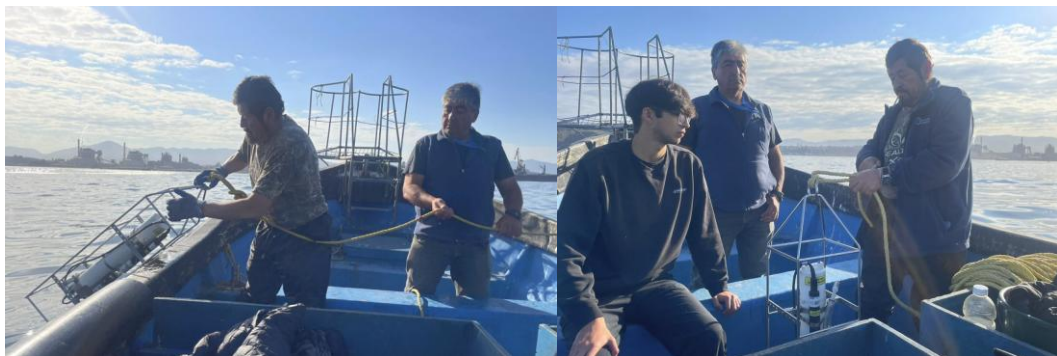
Figura 2 Despliegue de CTD en dos puntos de monitoreo con apoyo de integrantes de la Federación de pescadores y la academia.

El procedimiento se efectuó desde una embarcación, mediante el descenso controlado de la sonda CTD a través de la columna de agua hasta el fondo. A medida que desciende, el equipo registra automáticamente los datos, que quedan almacenados en el dispositivo que no se puede alterar, para luego ser analizados por una institución independiente experta . Este mecanismo de registro asegura la trazabilidad de la información y permite la comparación de resultados entre campañas.